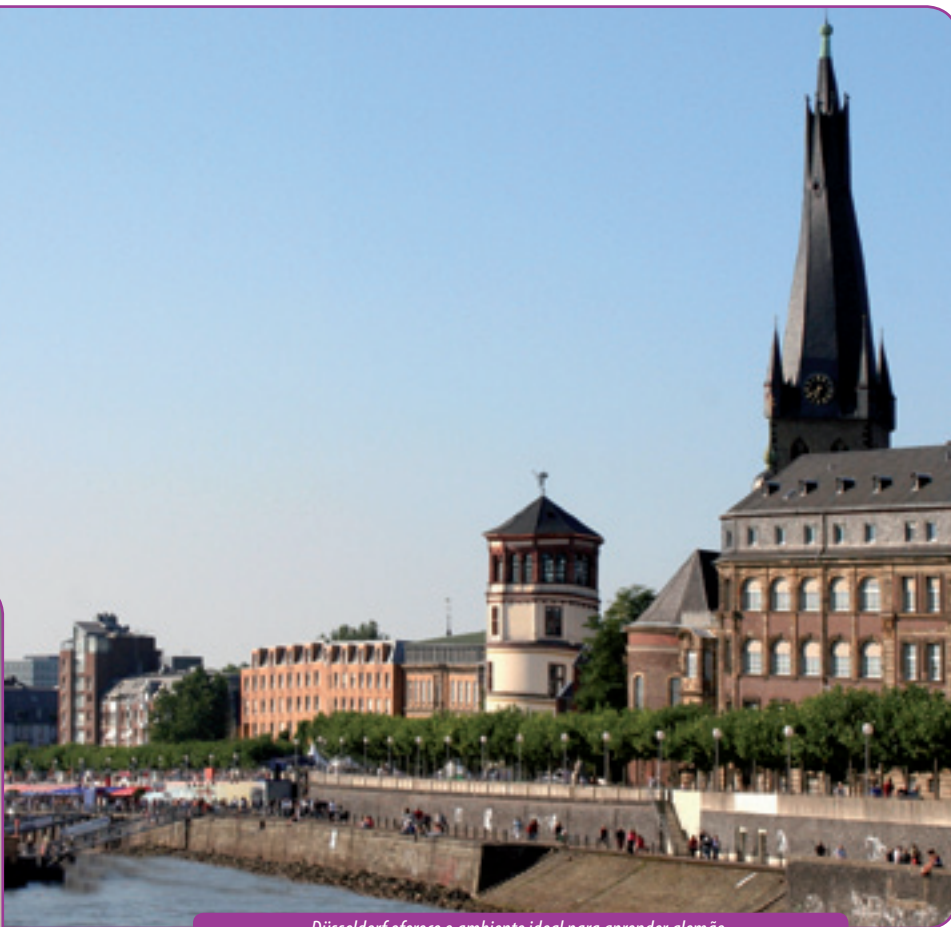
Düsseldorf oferece o ambiente ideal para aprender alemão.