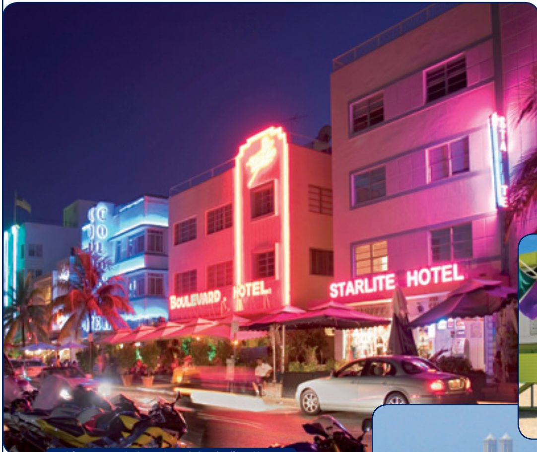
A famosa região Art Deco próxima da Sprachcaffe em Miami.

Opção ideal para aqueles que querem aprender inglês em um destino que combina praias, compras e intensa vida noturna. Miami é perfeita para quem quer estudar, mas também não abre mão das facilidades de uma cidade bem estruturada.