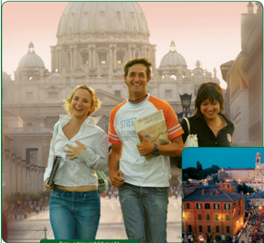
Roma - a eterna capital do mundo!

Ideal para aqueles que pretendem aprender italiano e gostam da atmosfera de cidades grandes. Estudar em Roma significa conhecer uma das cidades mais importantes para a história e uma das mais ricas arquiteturas e culturas do mundo, além de ter inúmeras opções de entretenimento.