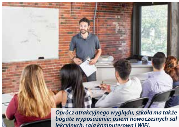
Oprócz atrakcyjnego wyglądu, szkoła ma także bogate wyposażenie: osiem nowoczesnych sal lekcyjnych, sala komputerowa i WiFi.