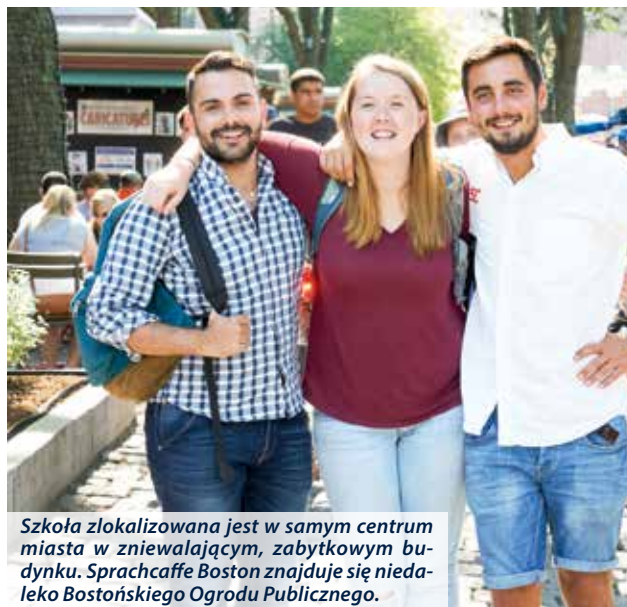
Szkoła zlokalizowana jest w samym centrum miasta w zniwiałającym, zabytkowym budynku. Sprachcaffe Boston znajduje się niedaleko Bostońskiego Ogrodu Publicznego.