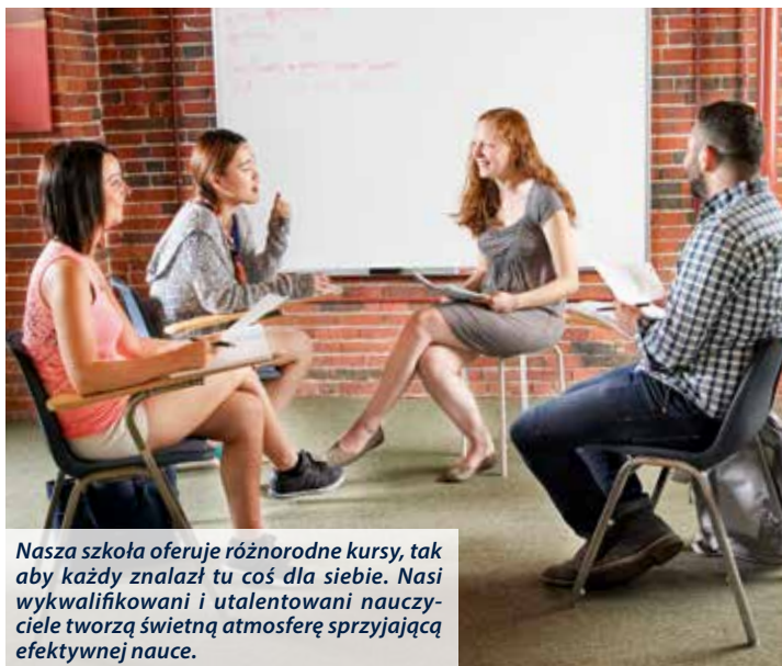
Nasza szkoła oferuje różnorodne kursy, tak aby każdy znalazł tu coś dla siebie. Nasi wykwalifikowani i utalentowani nauczyciele tworzą świetną atmosferę sprzyjającą efektywnej nauce.