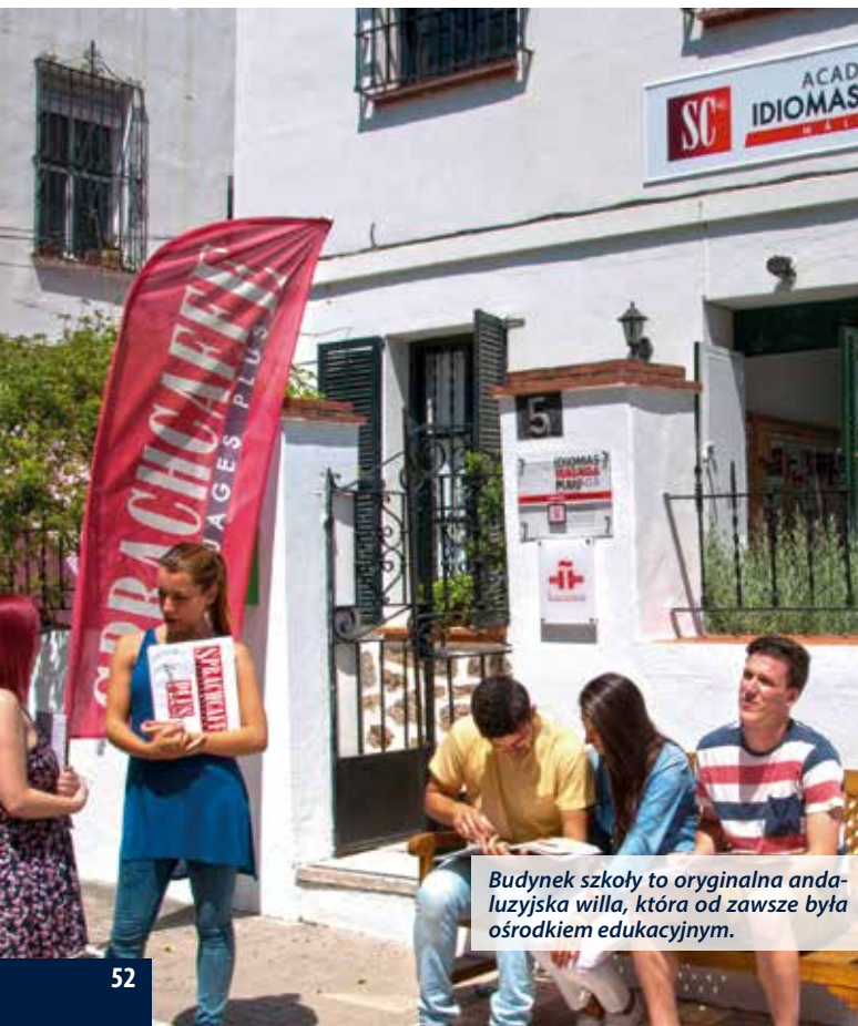
Budynek szkoły to oryginalna andaluzyjska willa, która od zawsze była ośrodkiem edukacyjnym.

Costa del Sol to ulubione miejsce Europejczyków gwarantujące piękną pogodę przez cały rok.