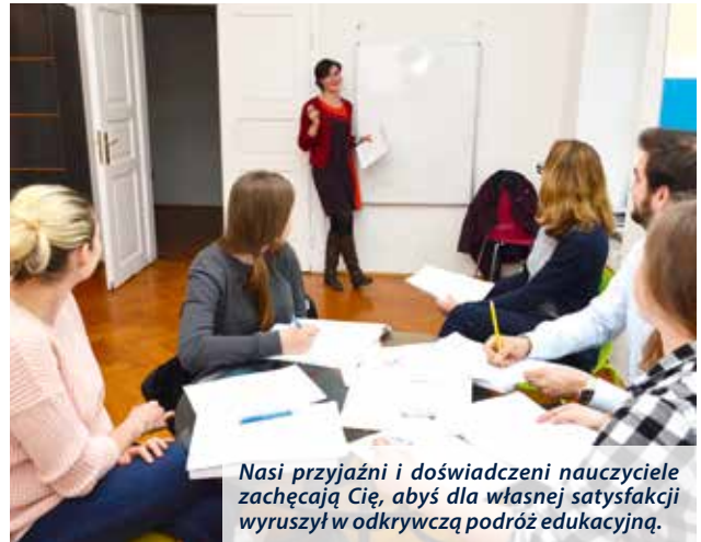
Nasi przyjaźni i doświadczeni nauczyciele zachęcają Cię, abyś dla własnej satysfakcji wyruszył w odkrywczą podróż edukacyjną.