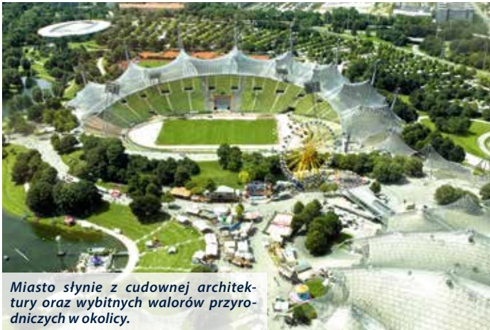
Miasto słynie z cudownej architektury oraz wybitnych walorów przyrodniczych w okolicy.