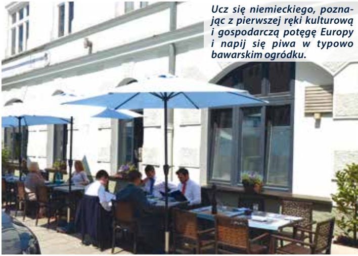
Ucz się niemieckiego, poznając z pierwszej ręki kulturę i gospodarczą potęgę Europy i napij się piwa w typowo bawarskim ogródku.