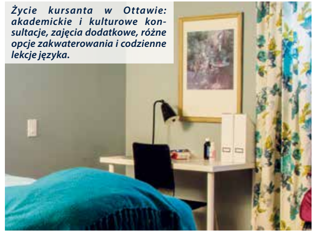
Życie kursanta w Ottawie: akademickie i kulturowe konsultacje, zajęcia dodatkowe, różne opcje zakwaterowania i codzienne lekcje języka.