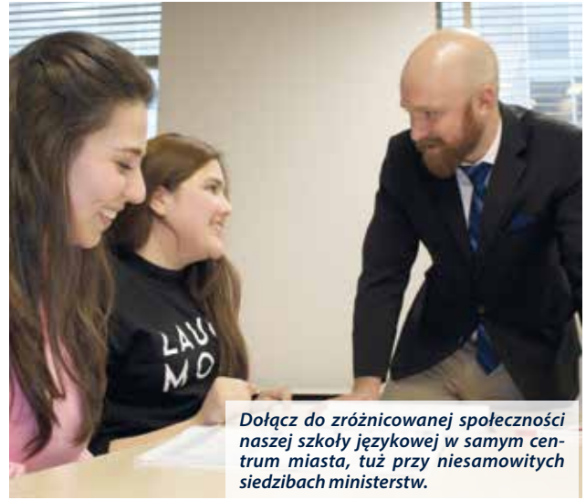
Dołącz do zróżnicowanej społeczności naszej szkoły językowej w samym centrum miasta, tuż przy niesamowitych siedzibach ministerstw.