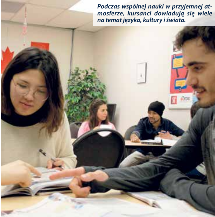
Podczas wspólnej nauki w przyjemnej atmosferze, kursanci dowiadują się wiele na temat języka, kultury i świata.