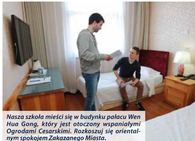
Nasza szkoła mieści się w budynku pałacu Wen Hua Gong, który jest otoczony wspaniałymi Ogradami Cesarskimi. Rozkoszuj się orientalnym spokojem Zakazanego Miasta.