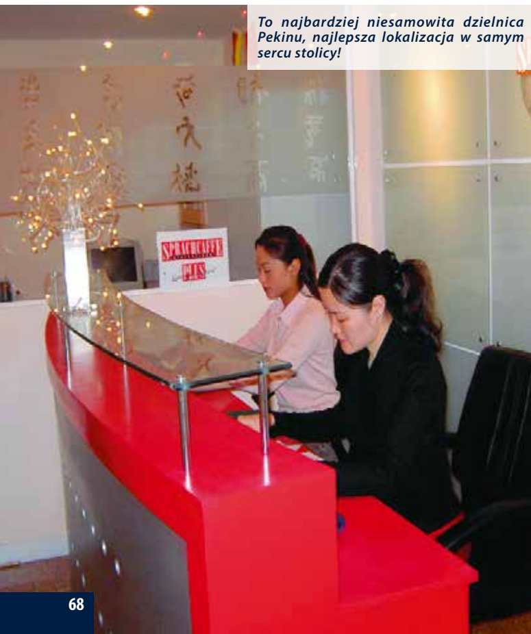
To najbardziej niesamowita dzielnica Pekinu, najlepsza lokalizacja w samym sercu stolicy!

Spotkanie z przepychem i ogromem stolicy Chin zapiera dech w piersiach.