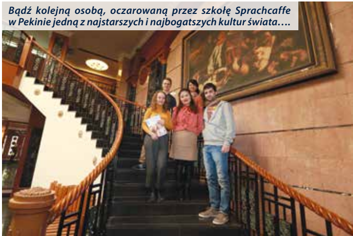
Bądź kolejną osobą, oczarowaną przez szkołę Sprachcaffe w Pekinie jedną z najstarszych i najbogatszych kultur świata....