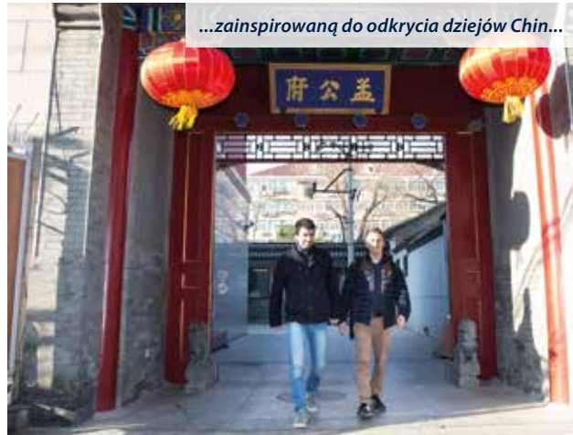
...zainspirowaną do odkrycia dziejów Chin...