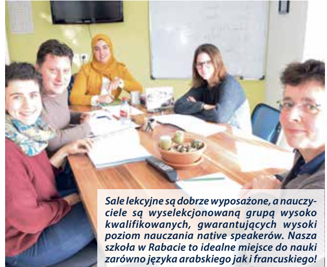
Sale lekcyjne s ą dobrze wyposa ż one, a nauczyciele s ą wyselekcjonowan ą grup ą wysoko kwalifikowan y ch, gwarantuj ą c y ch wysoki poziom nauczania native speaker ów . Nasza szkoła w Rabacie to idealne miejsce do nauki zar ó wno j ę zyka arabskiego jak i francuskiego!