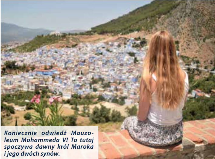
Konieczn ie odwiedź Mauzoleum Mohammeda V! To tutaj spoczywa dawny król Maroka i jego dwóch synów.