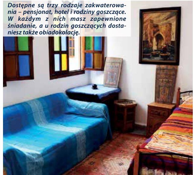
Dostępne s ą trzy rodzaje zakwaterowania – pensjonat, hotel i rodziny goszcz ą c e . W ka ż dem z nich masz zapewnione śniadanie, a u rodzin goszcz ą c y ch dostaniesz tak ż e obiadow ą kolację.