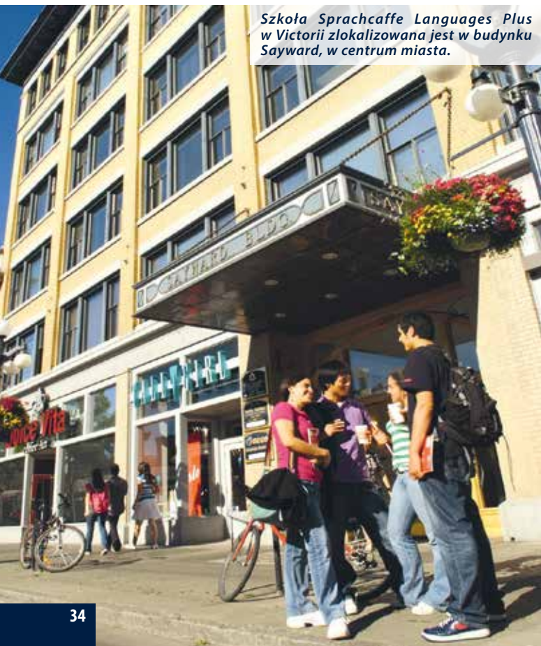
Szkoła Sprachcaffe Languages Plus w Victorii zlokalizowana jest w budynku Sayward, w centrum miasta.

Miasto przyciąga wyjątkowym połączeniem wpływów brytyjskich z dziedzictwem rdzennych mieszkańców.